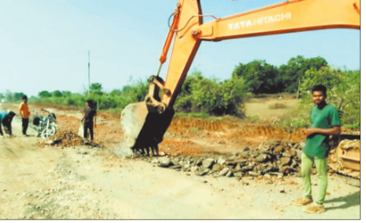
सड़क का निर्माण कार्य तेजी से जारी।

पथलगांव से कुनकुरी के बीच निर्माणधीन राष्ट्रीय राजमार्ग 43 में आवागमन करने वाले लोगों की समस्याएं शीघ्र ही दूर होगी। सड़क पर उन्हे हिचगोले खाते नहीं गुजरना पड़ेगा और न ही कहीं आने जाने में अपना कीमती समय बर्बाद करना पड़ेगा। मुख्यमंत्री विष्णु देव साय के निर्देश पर पथलगांव से कुनकुरी के बीच सड़क के कार्यों को तेजी से पूरा किया जा रहा है। मजदूरों की संख्या बढ़ाई गई है। सड़क निर्माण कार्य कराने वाली कंपनी को भी इस संबंध में कड़े निर्देश दिए गए हैं। मुख्यमंत्री के निर्देश के पश्चात कलेक्टर डॉ रवि मित्तल द्वारा भी सड़क के कार्यों का निरीक्षण कर हर दिन के कार्यों की समीक्षा की जा रही है। कंपनी के प्रतिनिधि के मुताबिक सीसी रोड के निर्माण कार्य को इस माह के अंत तक पूर्ण कर लिया जाएगा। जशपुर मुख्यालय सहित यहां से पथलगांव और अन्य स्थानों में आने-जाने के लिए महत्वपूर्ण नेशनल हाईवे-43 सड़क निर्माण कार्य की गति को अब बढ़ा दिया गया है। मुख्यमंत्री विष्णुदेव साय के निर्देश के पश्चात