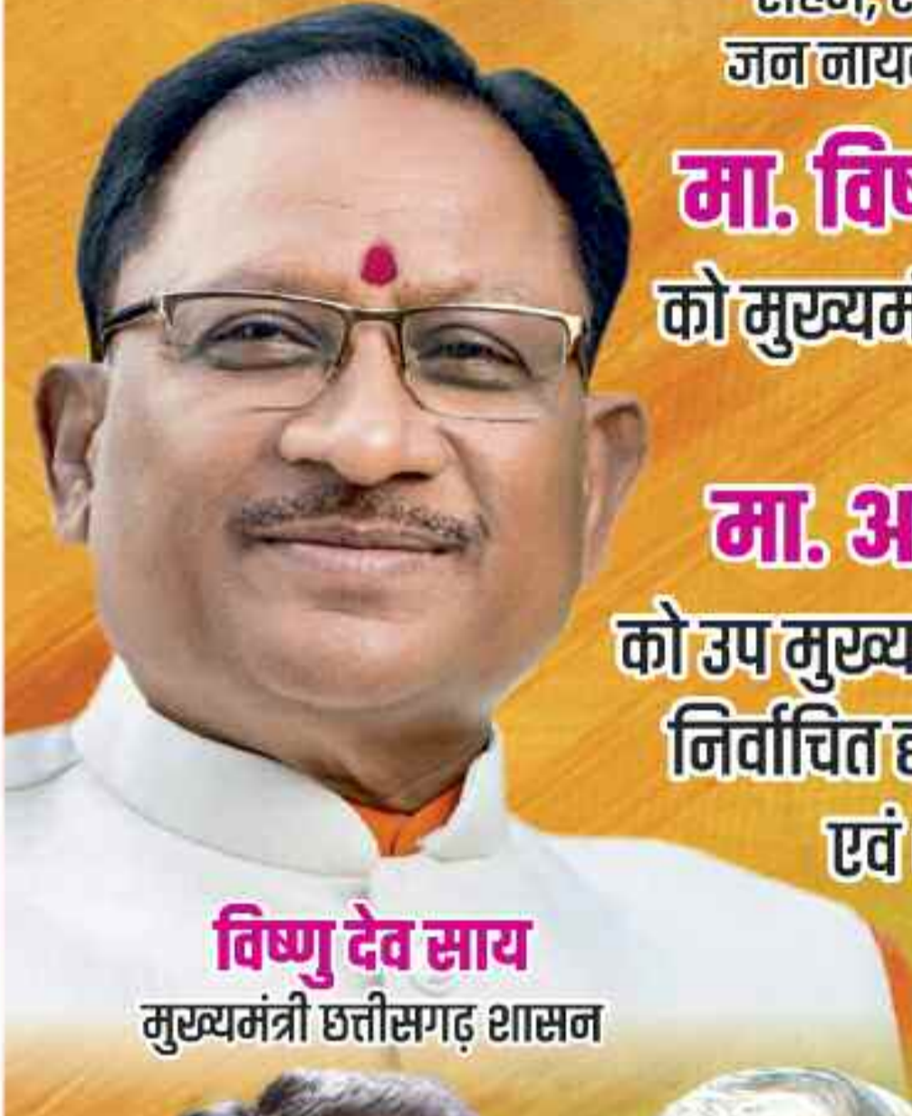
विष्णु देव साय मुख्यमंत्री छत्तीसगढ़ शासन

मा. अरुण साव जी को उप मुख्यमंत्री छत्तीसगढ़ शासन निर्वाचित होने पर हार्दिक बधाई एवं शुभकामनाएं